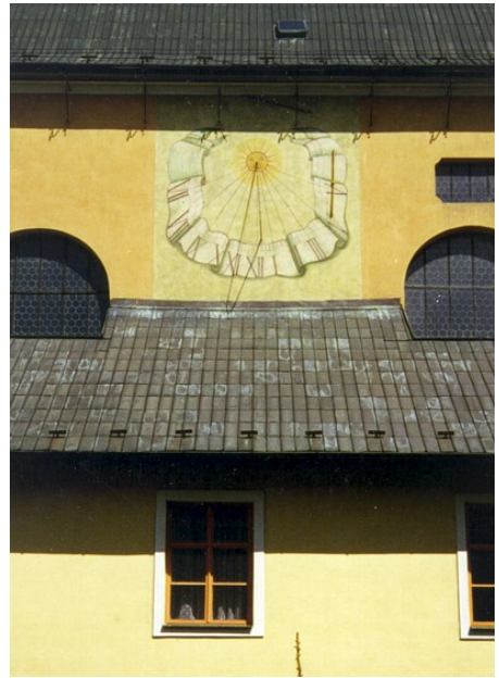
Obr. 4 — Havlíčkův Brod . Sluneční hodiny na stěně atria kostela svaté Rodiny v Havlíčkově Brodě v Horní ulici. Pocházejí z 16. století a mají časovou stupnici dělenou po čtvrt hodině. Foto Jan Trebichavský (2000).