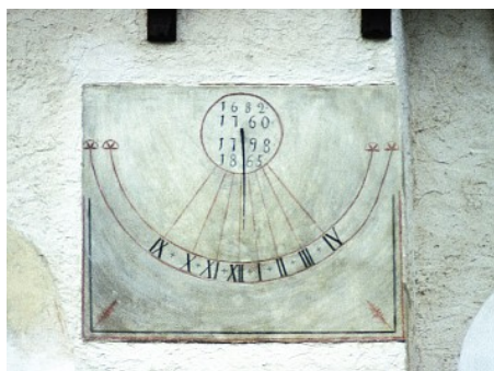
Obr. 8 — Kočí . Sluneční hodiny na zdi historického kostelíku svatého Bartoloměje v Kočí. Pocházejí snad z roku 1682. Přímo v číselníku jsou zapsána ještě tři data jejich renovací (1760, 1798, 1865). Foto Miroslav Brož (2002).