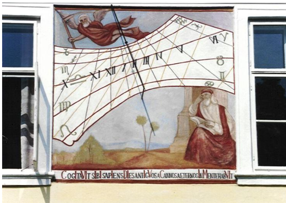
Sluneční hodiny v Kladrubech nad Labem