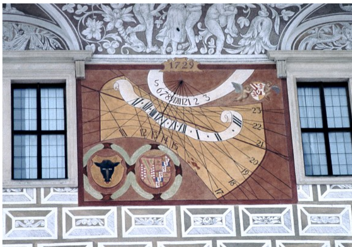
Obr. 10 — Litomyšl . Na zámku v Litomyšli jsou dvoje sluneční hodiny. První jsou viditelné již při příchodu k zámku, druhé až z nádvoří. Hodiny jsou výtvarně i gnomonicky zajímavé. Oboje mají na číselníku datové křivky a venkovní navíc i číselník pro dobu uplynulou od západu Slunce předchozího dne. Na vnitřních hodinách je latinský nápis „HOC VNO EXVRGIT VESTER DECOR OMNIS AB AXE“ a chronogram MDCCXXVVII. Foto Martin Navrátil (1994).