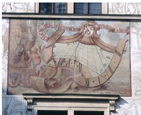
Obr. 11 — Litomyšl . Druhé hodiny na zámeckém nádvoří. Foto Martin Navrátil (1994).