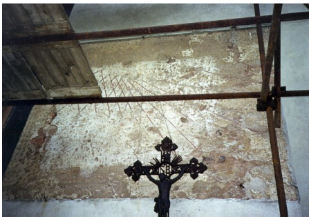
Obr. 3 — Horní Branná . Původně gnómonic-ky bohaté sluneční hodiny na kostele svatého Mikuláše v Horní Branné (stěna má azimut -10^\circ ). Na číselníku bylo možné odečítat hodiny, dobu uplynulou od západu Slunce i datum.