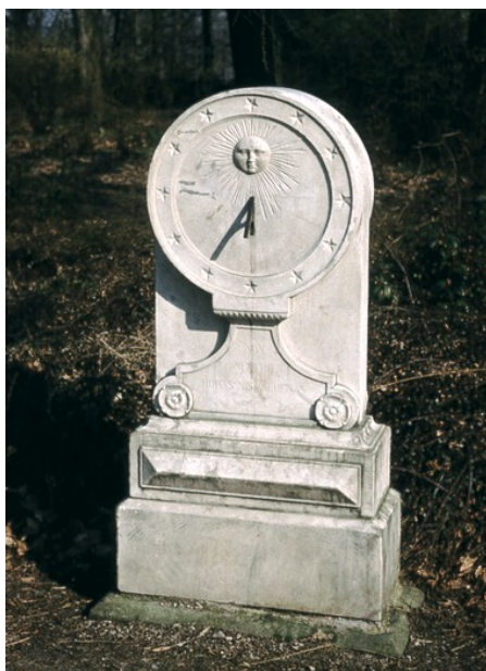
Obr. 12 — Žamberk . Sochařské sluneční hodiny v žamberském parku pocházejí z počátku 17. století. Svým tvarem připomínají spíše pomník. Je na nich latinský nápis „NON NUMERO HORAS NISI SERENAS“.