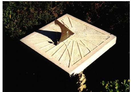
Obr. 5 — Stará Paka . Vodorovné sluneční hodiny jsou ve Staré Pace v zahradě rekreační chaty v Letné ulici 55. Mají kulísový ukazatel a jsou provedeny jako snímatelné z podstavce.