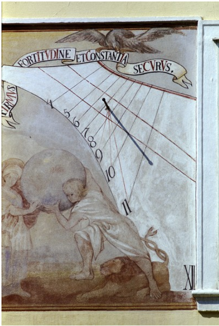
Obr. 2 — Kladruby nad Labem . Druhé, VJV hodiny na hřebčíně, také z roku 1724. Foto Miroslav Brož (2002).